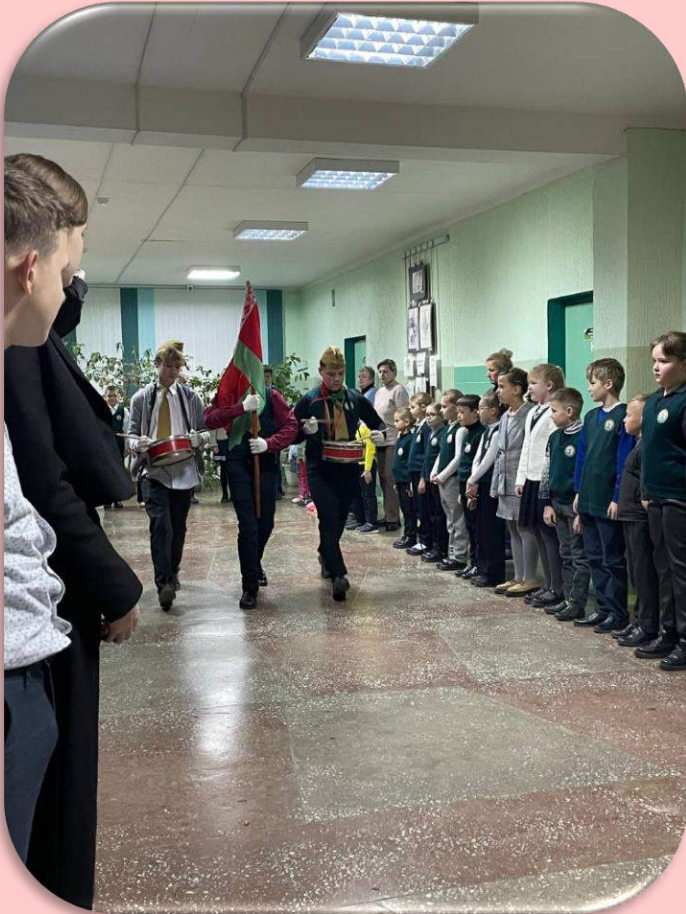
Фотаздымак з урачыстага прыёму ў піянеры ДУА “Грычынская БШ”

ВОСЕНЬ – АПОШНЯЯ, САМАЯ ЦУДОЎНАЯ ЎСМЕШКА ГОДУ УІЛЬЯМ К. БРАЙАНТ